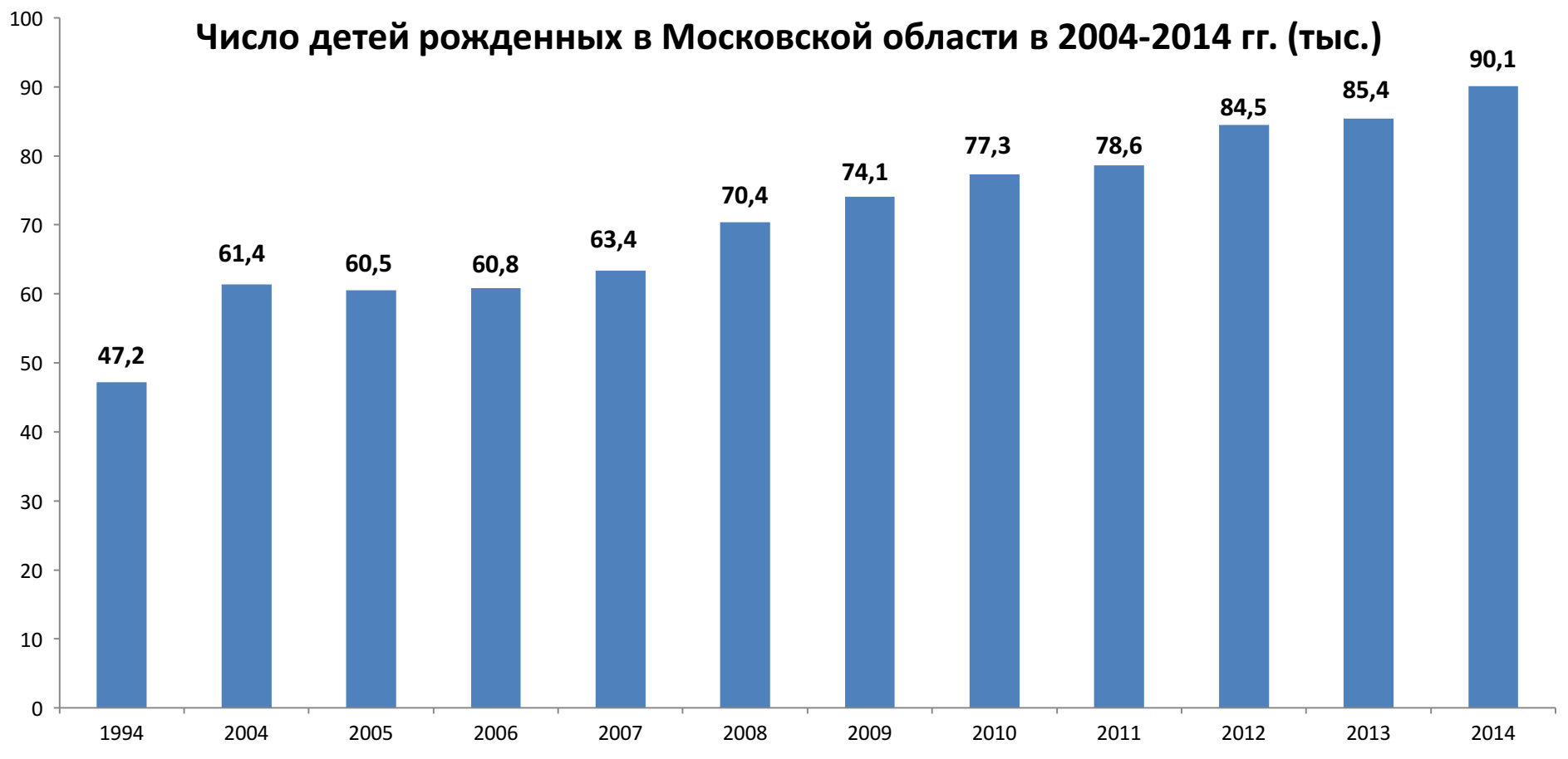
Число детей рожденных в Московской области в 2004-2014 гг. (тыс.)